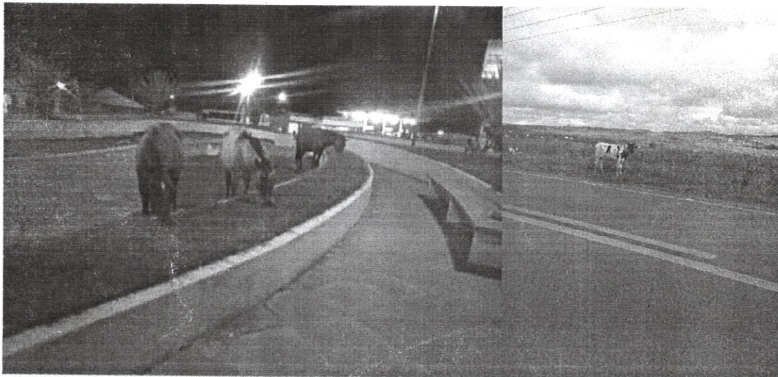
Animais soltos, na Praça do Centenário e na BR 416 da nossa cidade.

“Dispõe sobre a apreensão, registro e cadastramento de animais de grande porte soltos nas vias, praças, logradouros públicos e rodovias, pavimentadas ou não do Município de Colônia Leopoldina/AL e dá outras providências”.